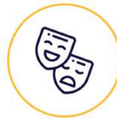
Drama dan Koreografi