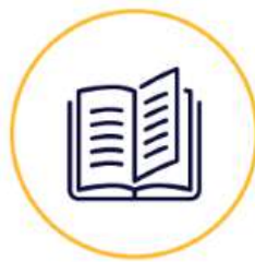
Buku dan Karya Tulis

Musik dan foto, adalah sebagian contoh dari kreasi yang dilindungi oleh Hak Cipta. Kreasi lainnya dalam bidang ilmu pengetahuan, seni, dan sastra bisa dilindungi oleh Hak Cipta, seperti :