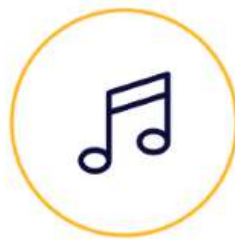
Musik dan Lagu