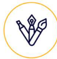
Karya Seni Rupa